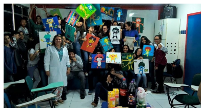
Exposição de Artes