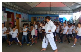
Aulas de Karatê