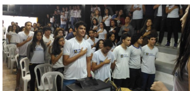
Momento de Cidadania—EM