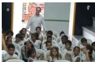
Encontro com Autores