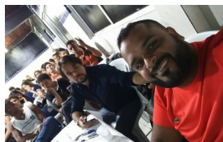
Aulões Interdisciplinares - ENEM

*Confira outras fotos no site e nas redes sociais do Colégio