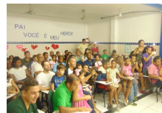
Dia da Família - Oficina do s Pais