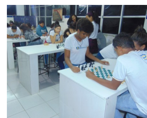
Aulas de Xadrez